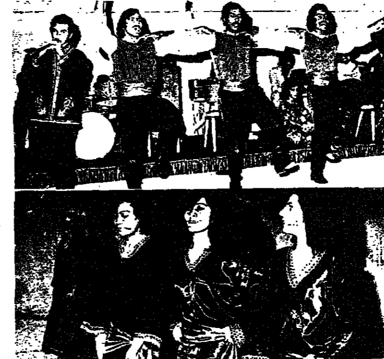
رقصة بيكة : افتتاح لبناني

وفي هذا السياق يمكن الإشارة الى ان عددا من المرحيات قد طلبته الحكومة